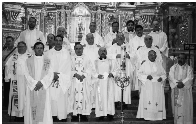
Los sacerdotes presentes vivieron un día de acción de gracias

Nosotros queremos dar gracias a Dios por todos los sacerdotes que han pasado por nuestra vida; le pedimos que los cuide y los bendiga, y que nos conceda a nuestra comunidad parroquial nuevas y jóvenes vocaciones sacerdotales.