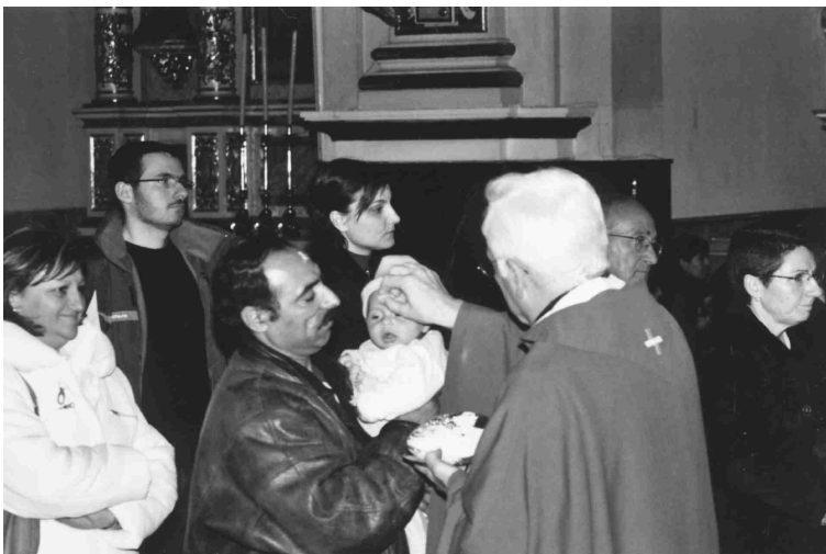
Con la imposición de ceniza se abren cuarenta días de preparación

GRACIAS SEÑOR JESUS PORQUE HAS RESUCITADO